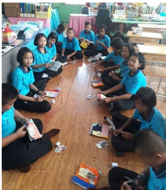
ภาพประกอบที่ 18 แสดงภาพอบรมการทำที่ใส่ดินสอจากผ้า