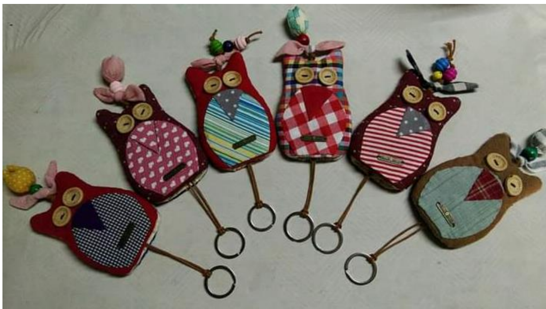
ภาพประกอบที่ 17 แสดงภาพผลงานที่ใส่พวงกุญแจ 2