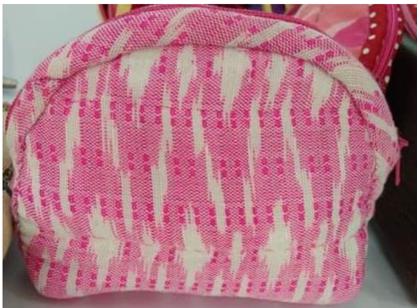
ภาพประกอบที่ 6 แสดงกระเป๋าตังค์จากผ้าฝ้าย