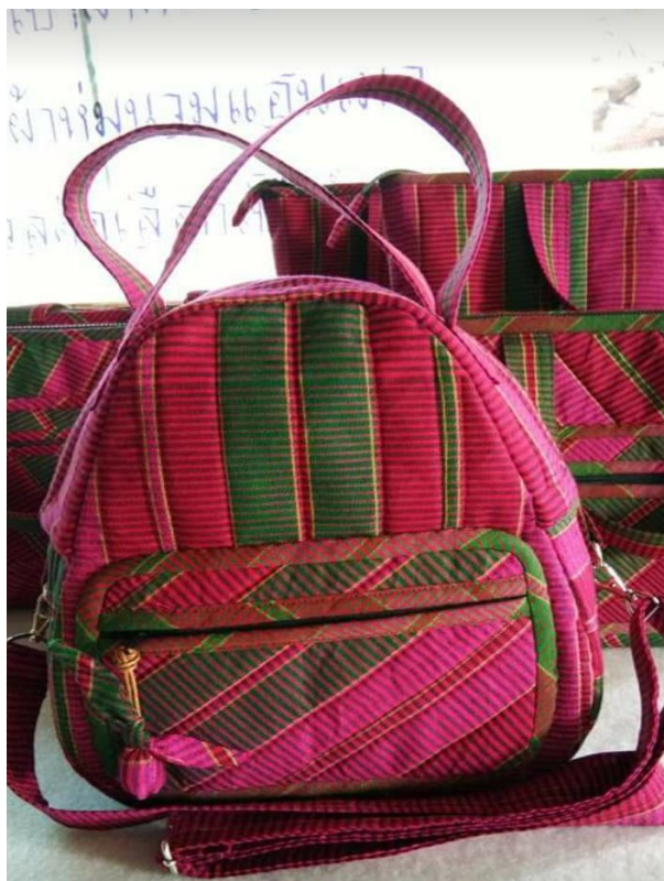
ภาพประกอบที่ 9 แสดงกระเป๋าเป้ผ้าขาม้า