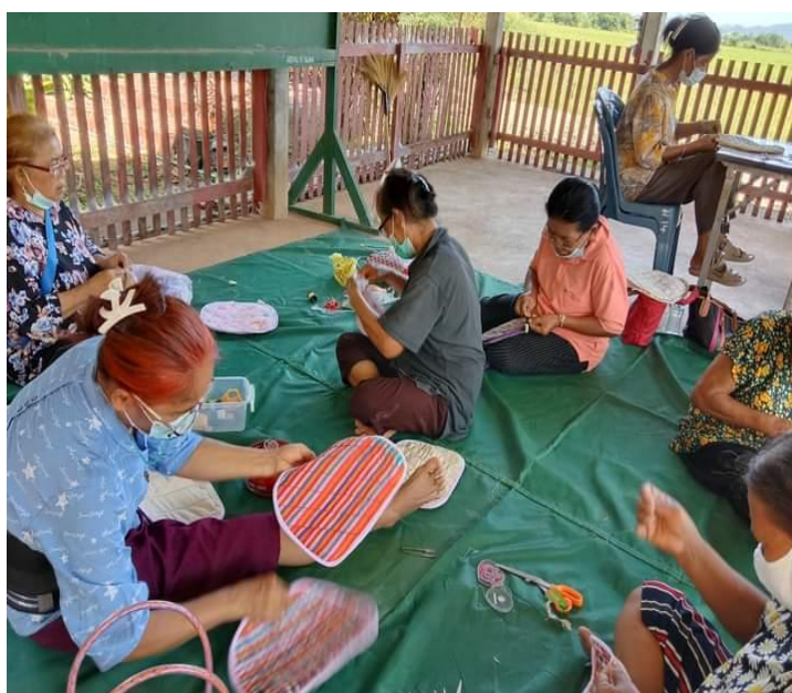
ภาพประกอบที่ 12 แสดงภาพการจัดอบรม 2