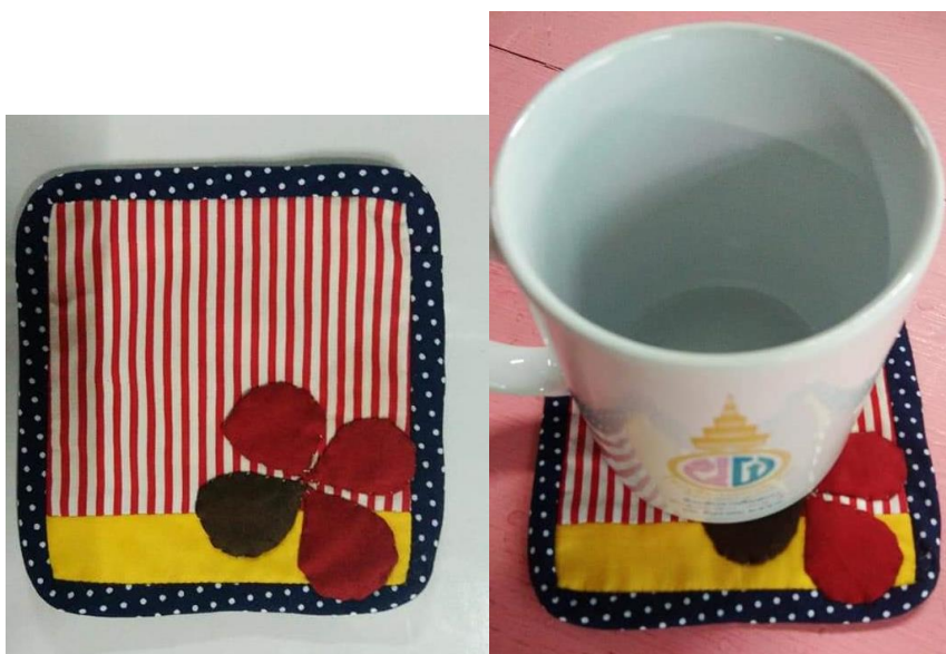
ภาพประกอบที่ 15 แสดงภาพผลงานที่รองแก้วทำจากผ้า