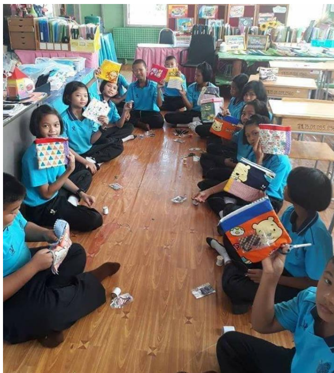
ภาพประกอบที่ 19 แสดงภาพผลงานที่ไ้่ดินสอ