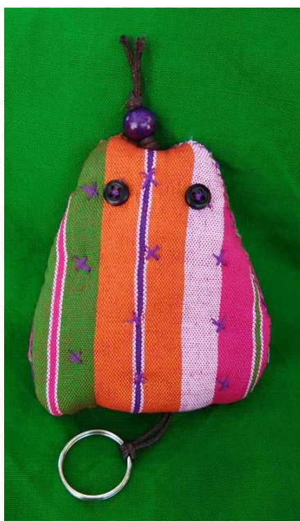
ภาพประกอบที่ 16 แสดงภาพผลงานที่ใส่พวงกุญแจ 1