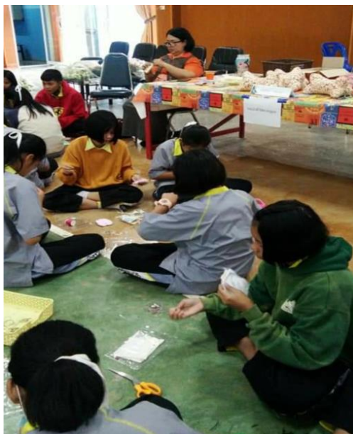
ภาพประกอบที่ 14 แสดงภาพการอบรมนักเรียน 1

2. กลุ่มนักเรียนโรงเรียนหนองไผ่ สนใจการพัฒนาผลิตผ้าทอจากภูมิปัญญาท้องถิ่น แบบที่สามารถเย็บได้ด้วยมือแบบง่าย แต่ใช้งานได้จริง ได้แก่ ที่ใส่พวงกุญแจ ที่รองแก้ว และที่ใส่ดินสอ ดังภาพ