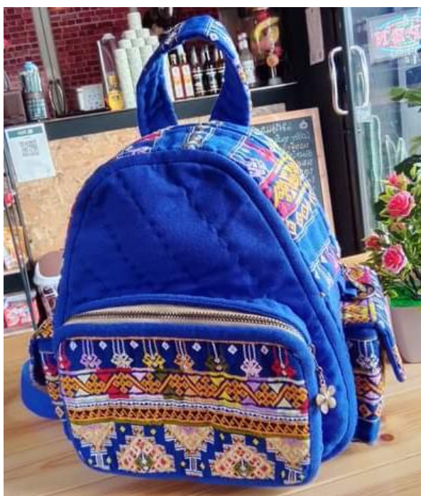
ภาพประกอบที่ 6 แสดงกระเป๋าเป้ตกแต่งด้วยผ้าซิด