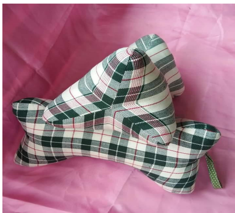
ภาพประกอบที่ 10 แสดงหมอนหนุนรองคอเพื่อสุขภาพจากผ้าฝ้าย