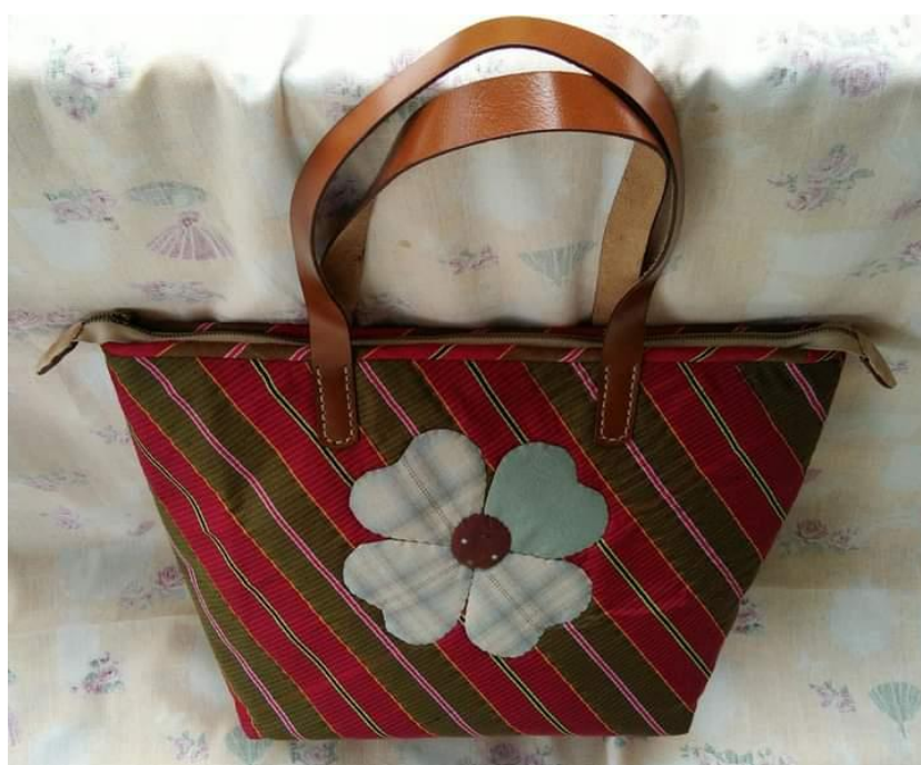
ภาพประกอบที่ 8 แสดงกระเป๋าถือสุภาพสตรีจากผ้าขาวม้า