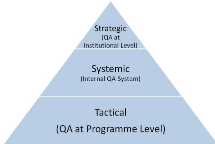
ภาพที่ 1.1 AUN-QA Assessment Model

Tactical เป็นการประกันคุณภาพระดับโปรแกรมหรือระดับหลักสูตร